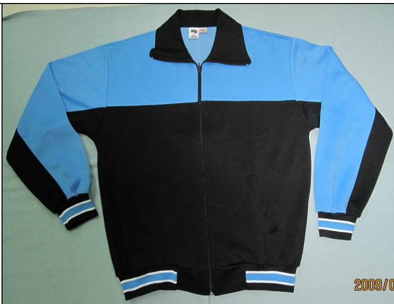
男、女生冬季 運動外套